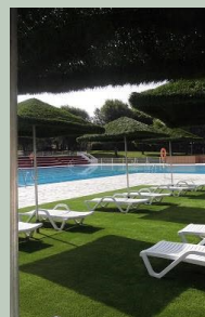
Instalaciones de la Garza

El Parque Deportivo La Garza es una instalación recreativa deportiva situado a 7 km de Linares y tiene una extensión de 400.000 m 2 . Está ubicado en un paraje de singular belleza, rodeado de encinas, dehesa y vestigios del pasado minero de la ciudad y a tan solo 15 minutos en coche de las ciudades de Úbeda y Baeza, Patrimonio de la Humanidad. Un espacio ideal para el desarrollo de actividades deportivas y disfrutar de la naturaleza y del tiempo de ocio.