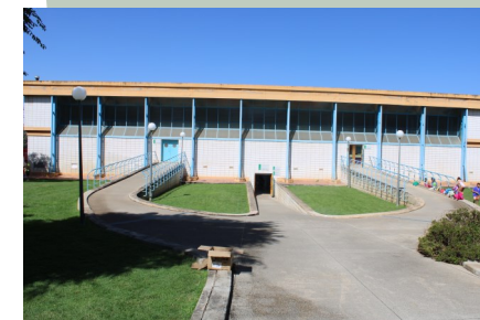
Pabellón Cubierto La Garza